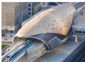
Dubai Metro Redline / Greenline