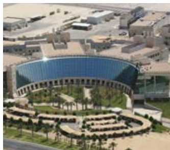
Research & Development Center- Aramco