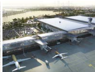
Bahrain New Airport