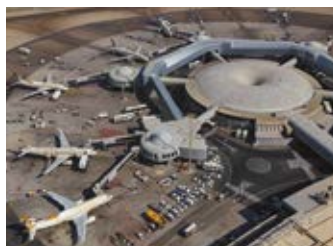
Abu Dhabi Airport