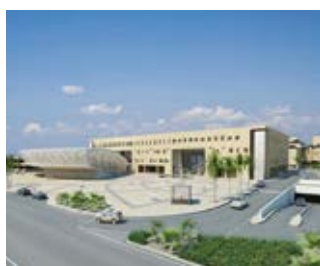
King Khalid University Hospital