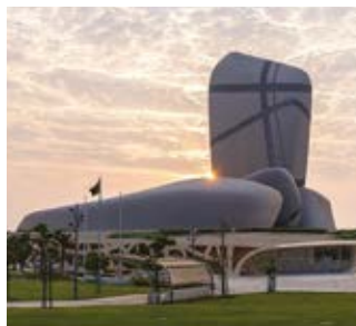
King Abdulaziz Center for World Culture