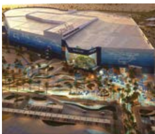
SeaWorld Abu Dhabi