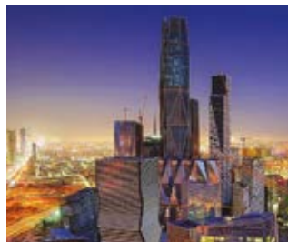
King Abdullah Financial District