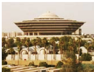
Ministry of Interior