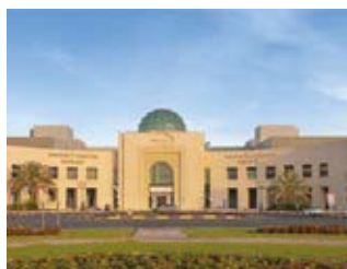
Sharjah Hospital University