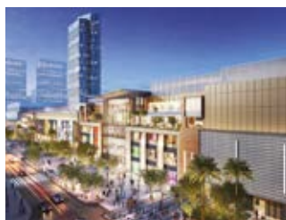
Al Maryah Shopping Mall