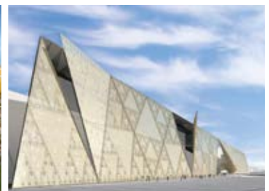
Grand Egyptian Museum